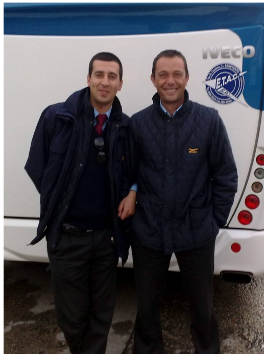
(operatori di esercizio)